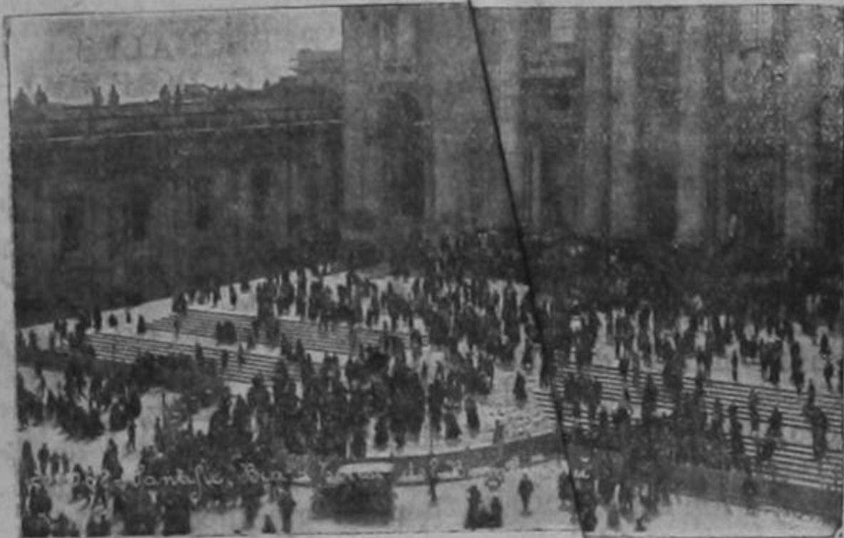
Afluencia de visitantes a San Pedro durante día de la canonización de Teresita