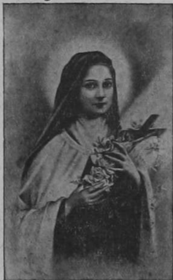
Se llamó «Florecilla»

Se llamó «Florecilla» Y con tanta pasión amó las flores, Que el más vivo dolor de sus dolores Era el ver sin sus flores la campiña.